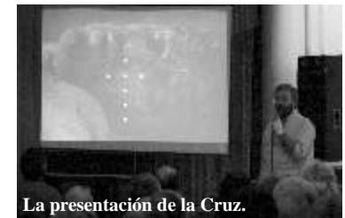
La presentación de la Cruz.