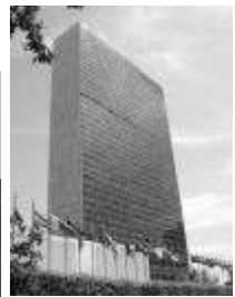
Asamblea General de las Naciones Unidas 2005

TEMAS CENTRALES: HAMBRE, GUERRA, TERRORISMO, SITUACIÓN MUNDIAL, ETC.