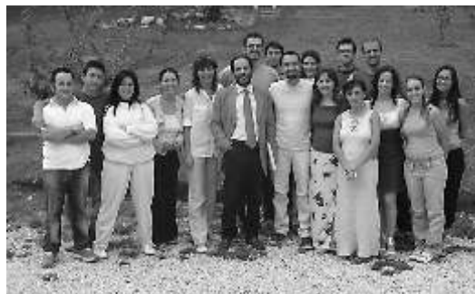
El juez Ingroia durante su visita en Arca 3

sobre procesos en curso, etc.) como de temas un poco más a la mano. Antes de irse nos hemos hecho una foto todos juntos debajo de la encina. Al día siguiente a las 8:30 hemos ido al Pabellón Deportivo de Porto Sant' Elpidio para preparar los stand con todo el material de ANTIMAFIA Duemila. Estaban presentes unos 400 estudiantes de las escuelas, a las 10:00 ha empezado la conferencia cuyo moderador era Fabio Regolo, aspirante magistrado y que ha sido presentada por el concejal Franchellucci. El título de la conferencia "La herencia de Falcone y Borsellino".