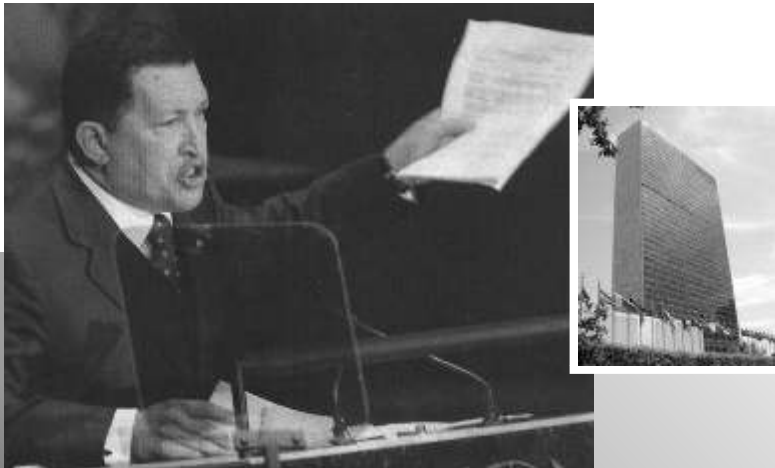
El presidente venezolano Hugo Chávez en momentos de su discurso en la ONU.

Necesitamos alas para volar, sabemos que hay una globalización neoliberal aterradora, pero también existe la realidad de un mundo interconectado que tenemos que enfrentar no como un problema sino como un reto, podemos, sobre la base de las realidades nacionales, intercambiar conocimientos, complementarnos, integrar mercados, pero al tiempo debemos entender que hay problemas que ya no