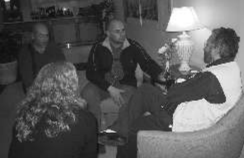
Giorgio con algunos medios de prensa en la ciudad de Rosario.

"Los Raúles" -como amigablemente los llamamos- traían la edición del primer Boletín "Del Cielo a la Tierra" editado en la Argentina.-