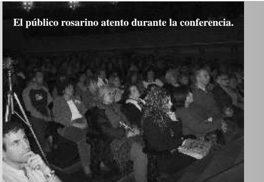
El público rosarino atento durante la conferencia.