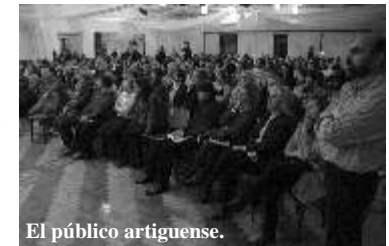
El público artiguense.